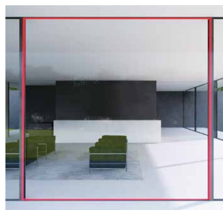
Dichtung aktiv – 100 % dicht